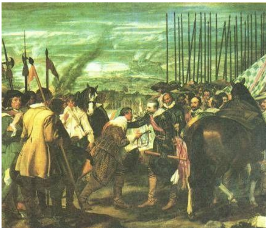
Веласкес Сдача Бреды