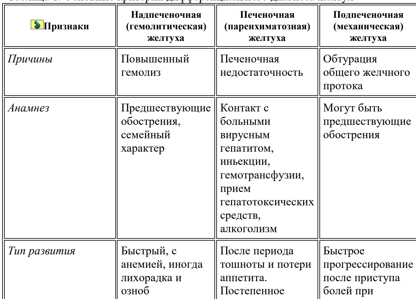
Таблица 1. Основные критерии дифференциального диагноза желтух

Выделяют 3 вида желтух: гемолитическая (надпеченочная), паренхиматозная (печеночная) и обтурационная (подпеченочная, механическая).