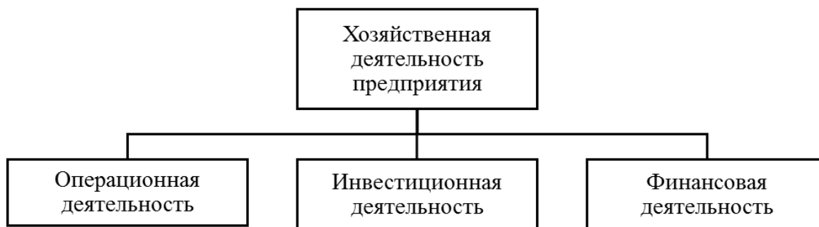
Рисунок 1.1 – Структура хозяйственной деятельности

На все рисунки должны быть ссылки в тексте;