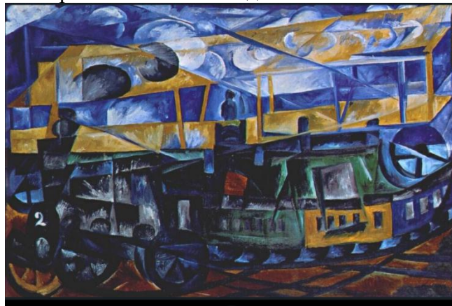
Гончарова Н.С. Кубофутуризм. Аэроплан над поездом. 1913г.