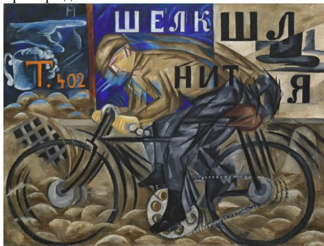
Гончарова Н.С. Велосипедист. 1913г.