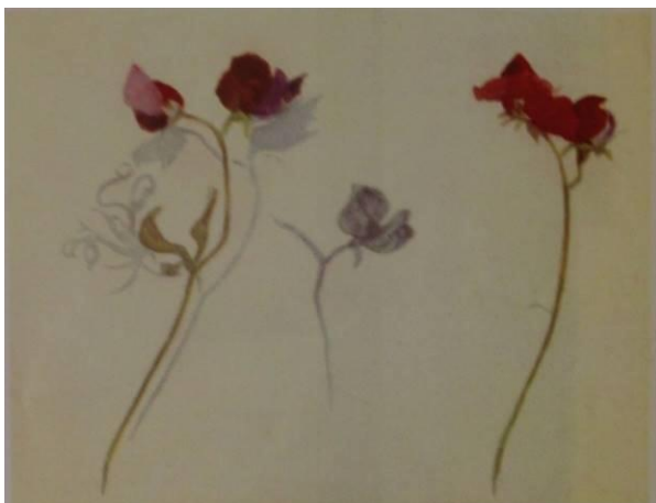
З.Е. Серебрякова. Душистый горошек.

собственный пластический и живописный язык, продемонстрировать индивидуальный подход.