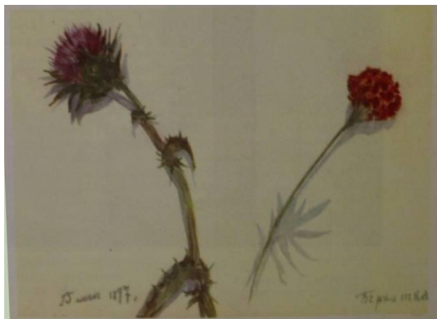
Татарник и бархотка. Акварель. 1897г.