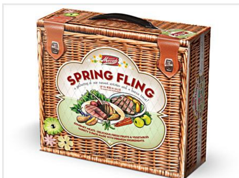
Рис. 4. Примеры упаковки

Композиционное решение определяет местоположение на картинном поле главного и второстепенного в изображении, расположение доминанты и всех смысловых и формальных элементов в соответствии с общей композиционной схемой, продиктованной содержанием – замыслом и трактовкой темы. Композиционные средства, с помощью которых выявляются смысловые связи, например, отношения между формами, - контраст, симметрия, масштаб – служат одновременно средствами гармонизации формы. Они придают целому визуальную стройность, уравновешенность, выразительность, организуя логическую последовательность восприятия формы и обеспечивая ее эмоциональную поддержку.