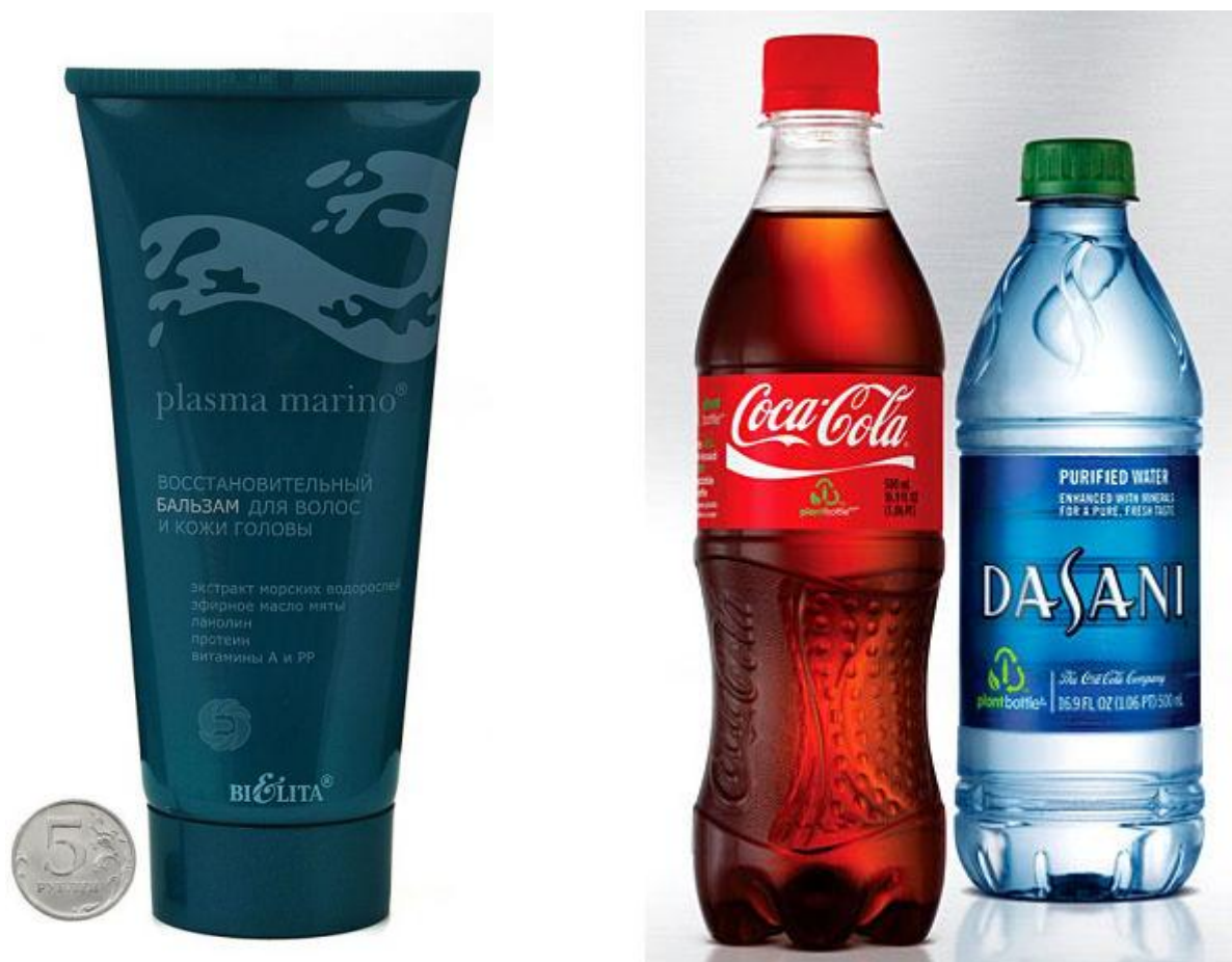
Рис. 2. Примеры упаковки