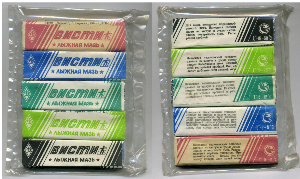
Рис. 1. Пример упаковки

При выборе цветовых решений, необходимо учитывать роль цвета, его воздействие на человека. Цвет способен воздействовать на физиологические процессы человека, на его психологическое состояние.