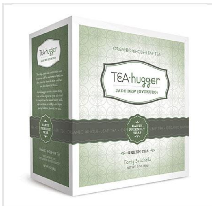
Рис. 3. Примеры упаковки