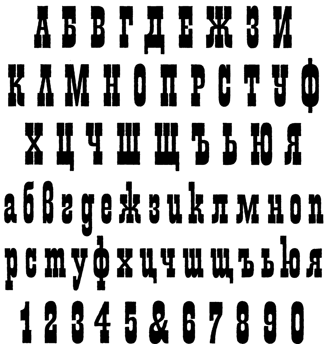
Рис.3. Гарнитура «Итальянский шрифт»

Требования. Задание выполняется на планшете 40х60. Материалы: гуашь, тушь, темпера (рис.3).