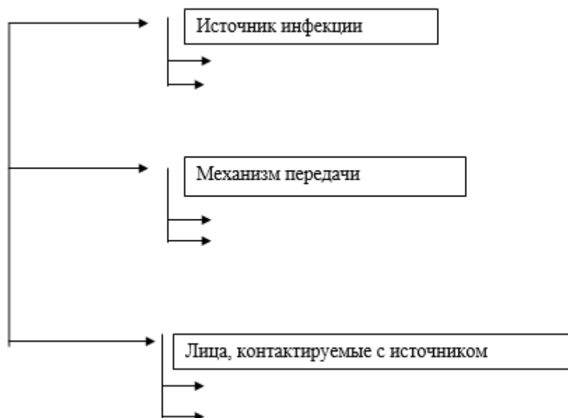
Схема. Схема составления плана противоэпидемических мероприятий в очаге.

Назовите тип эпидемического очага, определите его границы, дайте прогноз развития и предложите меры по ликвидации. Составьте план противоэпидемических мероприятий в очаге. Представьте ответ в виде схемы. Укажите ведущие противоэпидемические мероприятия.