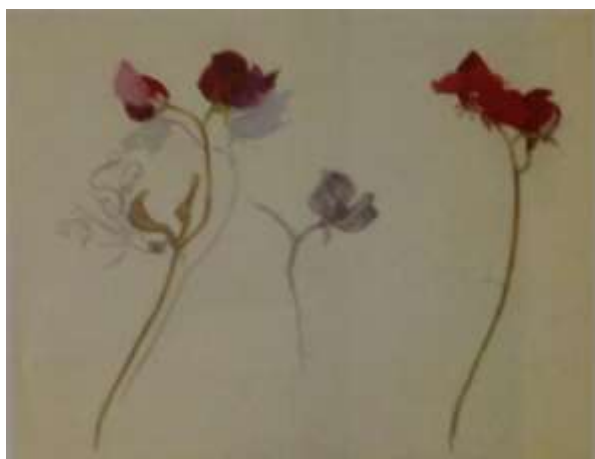
З.Е. Серебрякова. Душистый горошек.

Найденные в природе контрасты размеров, фактур, пластики ложатся в основу выразительного решения композиции из растительных мотивов.