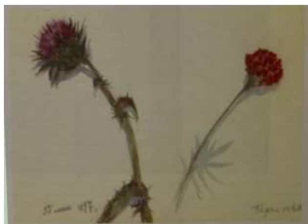
Татарник и бархотка. Акварель. 1897г.