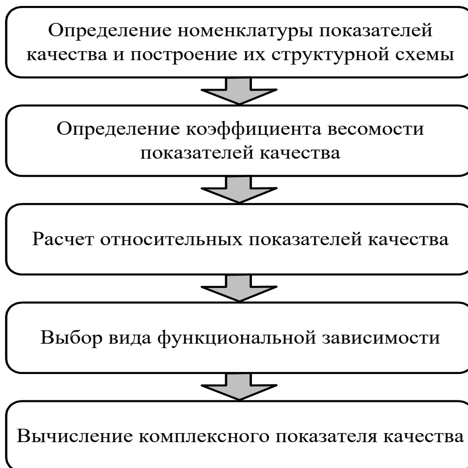
Рис. 3 Алгоритм расчета комплексного показателя качества

Таким образом, ремонтпригодность – сложное свойство изделия по отношению к T_0 и T_y . Следовательно, относительно коэффициента готовности K_T показатель T_B можно рассматривать как единичный, а относительно T_0 и T_y – как комплексный.