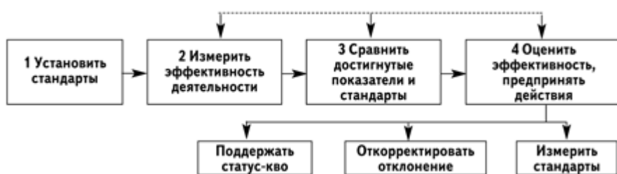
Рисунок 6 – Этапы процесса контроля

Вне зависимости от вида системы контроля в процессе контроля существует несколько основных этапов (рисунок 6).