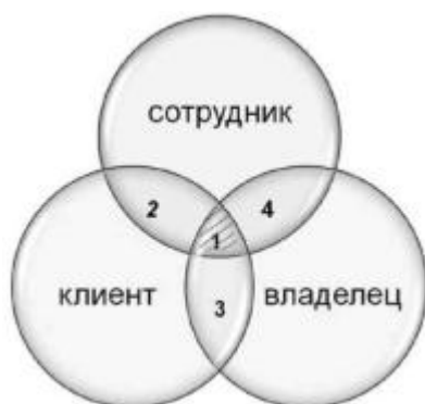
Рисунок 1 – Зоны пересечения интересов и ожиданий собственников, персонала и клиентов гостиницы

При подготовке описания регламентов поведения сотрудников данный подход дает возможность выявить наиболее полный объем правил, требующих стандартизации.