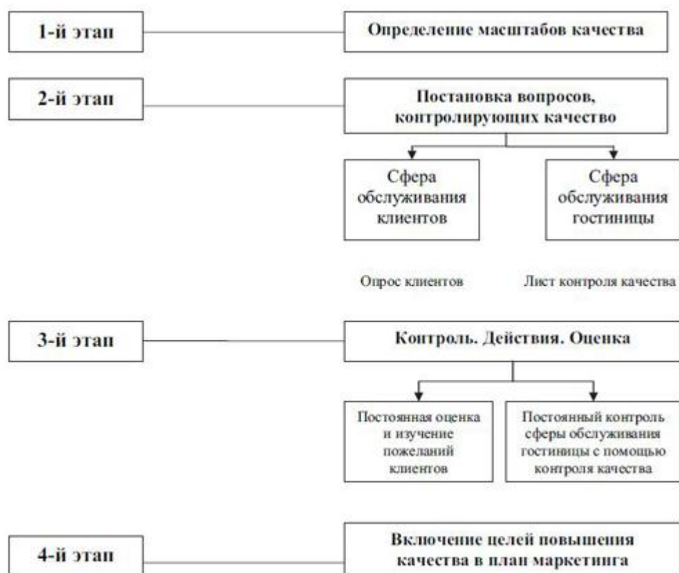
Рисунок 4 – Основной подход к контролю качества в гостинице

При разработке программы контроля качества необходимо руководствоваться следующими целями: