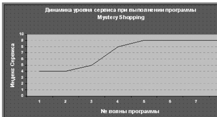
Рисунок 5 – график динамики уровня сервиса

Типичная динамика уровня сервиса на предприятии при выполнении программы Mystery Customer/Shopping отражена на следующей схеме (рисунок 5).