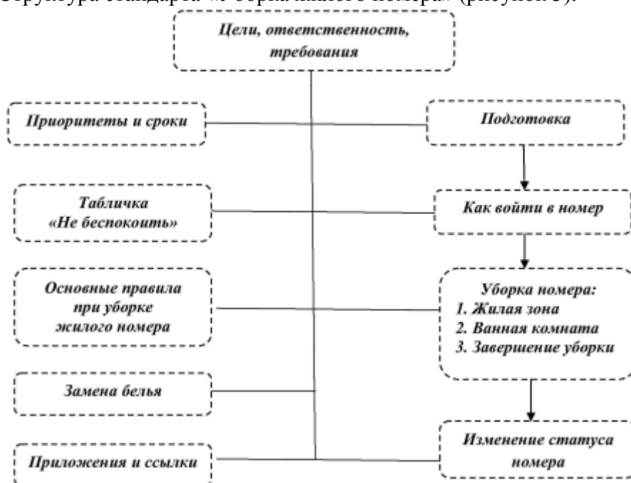
Рисунок 3 – Структура стандарта «Уборка жилого номера»

Структура стандарта «Уборка жилого номера» (рисунок 3).