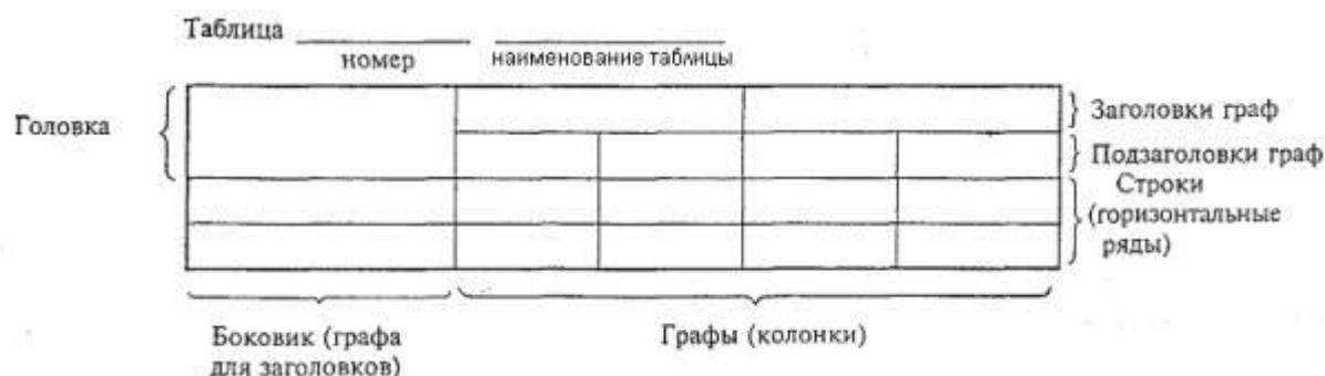
Рисунок 1 – Пример оформления таблицы

3.6.5 Цифровой материал, как правило, оформляют в виде таблиц. Пример оформления таблицы приведен на рисунке 1.