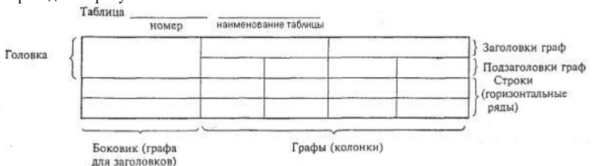
Рисунок 1 – Пример оформления таблицы

Цифровой материал, как правило, оформляют в виде таблиц. Пример оформления таблицы приведен на рисунке 1.