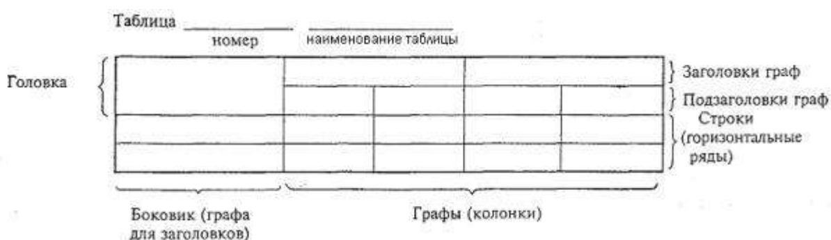
Рисунок 3 – Пример оформления таблицы

3.3.2.5 Цифровой материал, как правило, оформляют в виде таблиц. Пример оформления таблицы приведен на рисунке 3.