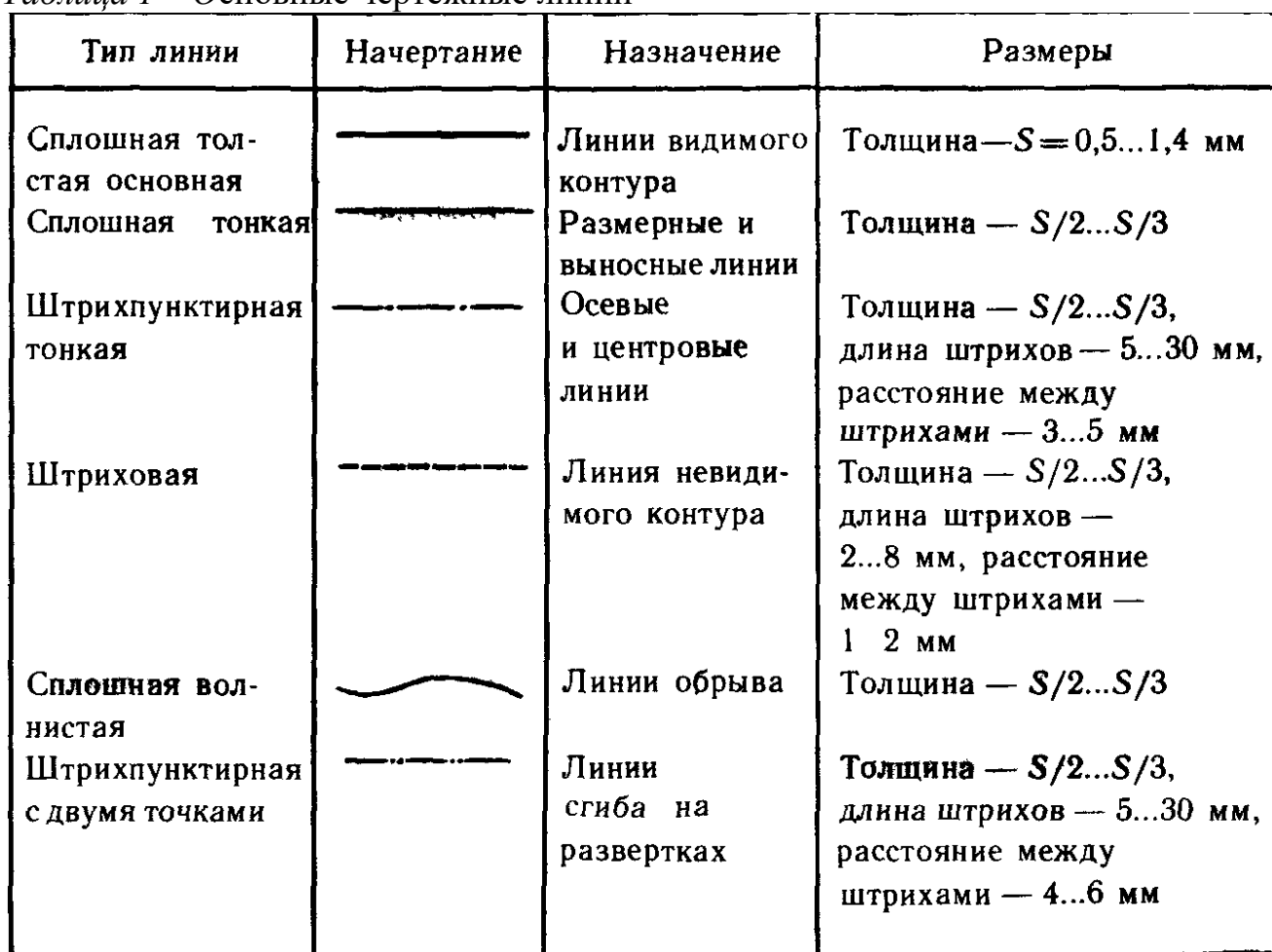
Таблица 1 – Основные чертежные линии